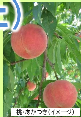
桃・あかつき(イメージ)